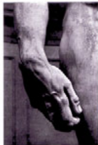
Particolare del David di Michelangelo (da Michelangelo Mappi, München, s.d., AGT)