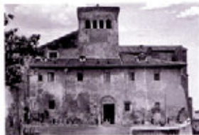
Chiesa dei Santi Quattro Coronati, Roma