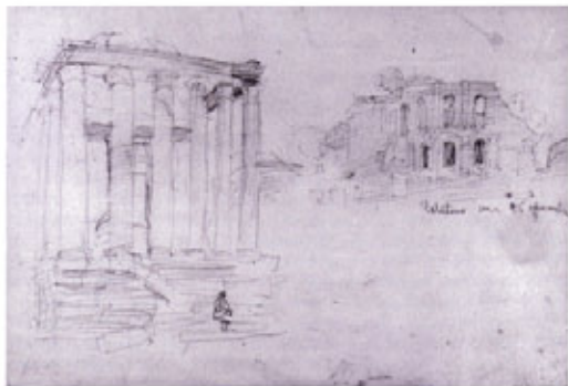
Veduta del Palatino, Roma, 26 novembre 1925 (AGT, album 1925)

tettura medievale previsto dal programma del triennio di applicazione della Scuola di architettura 17 . Nei giorni successivi lo troviamo al Vaticano, dove disegna il coronamento del colonnato di San Pietro e la pigna di bronzo nel cortile del Belvedere e abbozza una facciata di palazzo appuntando a margine "al fondo del cammino decoratissimo di maioliche". Visita i palazzi e i musei vaticani e ritrae oggetti nel museo egizio, nel museo etrusco e in quello etnologico.