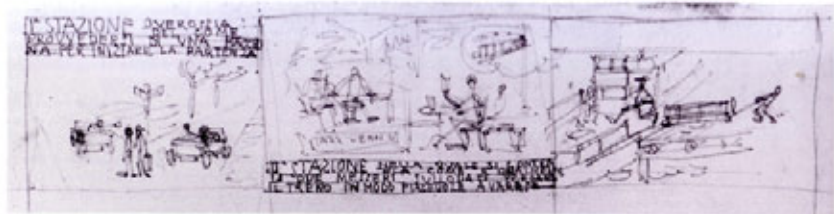
Vignetta dall'album 1923, primo episodio: la pateriva

nel 1921 e si laurea nel 1926. Per meglio comprendere il significato di questo viaggio sono opportuni alcuni cenni sulla Scuola di architettura in quegli anni. Gli studi erano organizzati in un corso preparatorio di due anni e in una scuola di applicazione di tre; nel primo anno l'esercitazione progettuale si svolgeva secondo i canoni dello stile greco-romano, nel secondo di quello rinascimentale, neoclassico e barocco, nel terzo e ultimo di quello medievale. La frequenza al Politecnico comportava anche l'iscrizione all'Accademia di Brera per lo studio delle discipline figurative. La lezione dei monumenti del passato, che nella scuola tendeva piuttosto alla formazione di un gusto eclettico, viene senz'altro assimilata da Terragni come incentivo per la conoscenza dei valori del passato, nella direzione della nuova architettura.