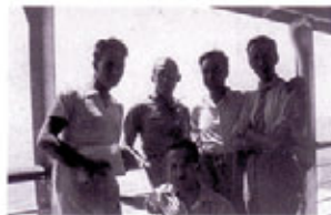
Giuseppe Terragni (a sinistra), Le Corbusier e Bardi sul ponte del Patris II, 1933