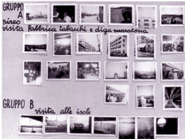
Una pagina dell'album di fotografie scattate da Giuseppe Terragni durante il viaggio in Grecia

Terragni nella sua relazione traccia le linee fondamentali del piano regolatore di Como che presenterà al concorso dell'anno successivo insieme a Bottoni e agli altri componenti del gruppo CM8 7 . La traccia della relazione originale in francese comprende, oltre a un'introduzione sulla storia di Como, i seguenti paragrafi: Le indicazioni geologiche, I venti, Le tendenze di sviluppo, Le caratteristiche della città, Note sull'aspetto fondiario, La popolazione, Le abitazioni, Il tempo libero, La circolazione. Il paragrafo finale del suo