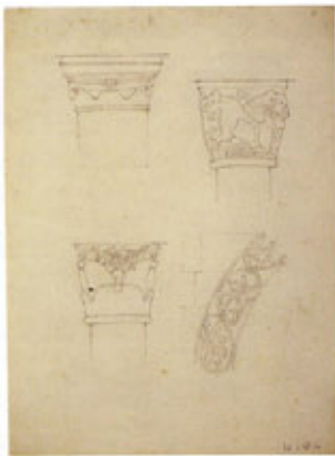
Rilievo dei capitelli e di un fregio di San Fedele, Como (AGT)

to della contemporaneità. Pensa che le nuove città di Berlino sono state costruite dal 1927 in poi.